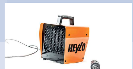
Elektroheizung 2 KW